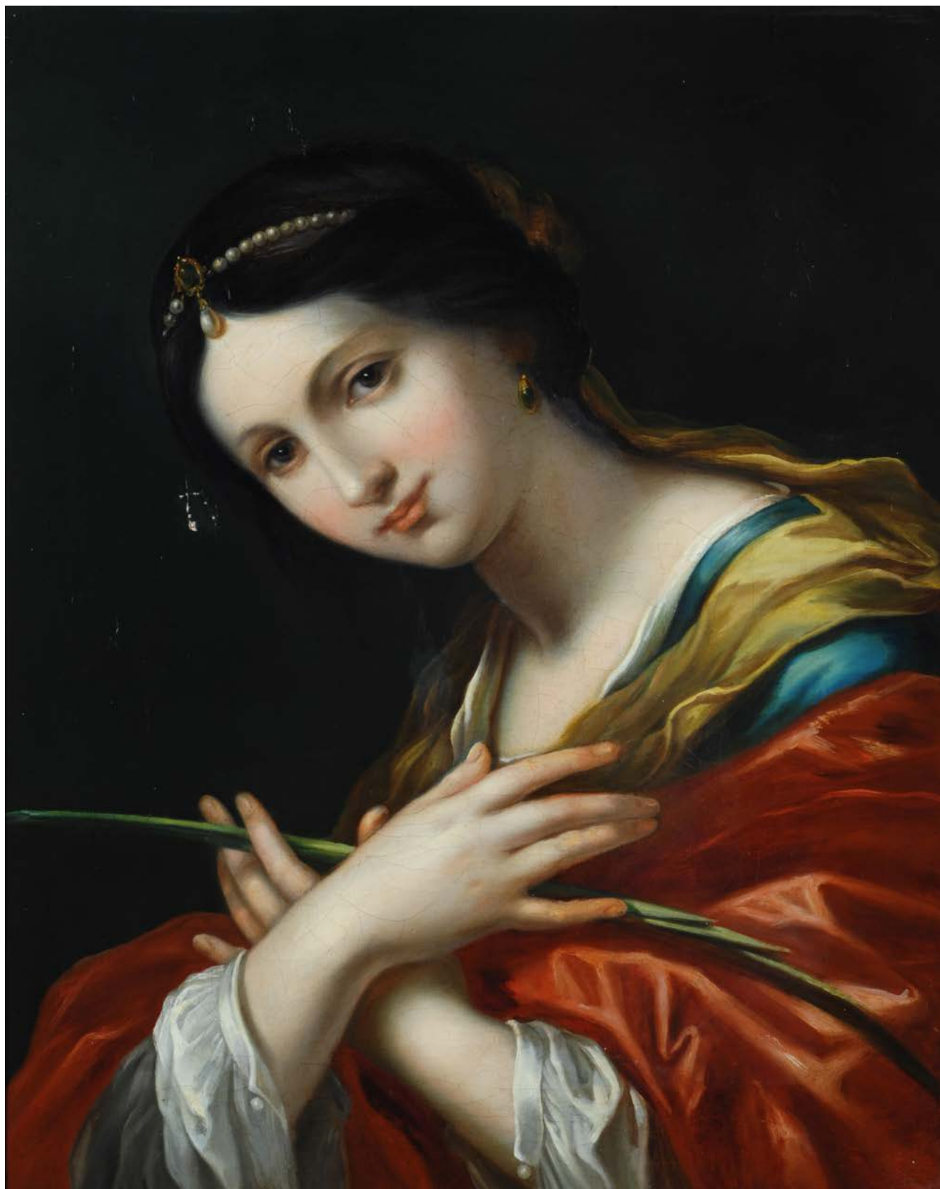
89bis Scuola Emiliana, XVII sec. SANTA MARTIRE Olio su tela, cm. 61,5x49