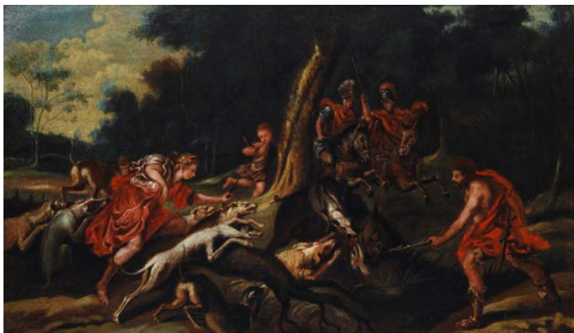
64 64 Scuola Italia centrale, XVII-XVIII sec. LA CACCIA DI DIANA Olio su tela, cm. 42x73