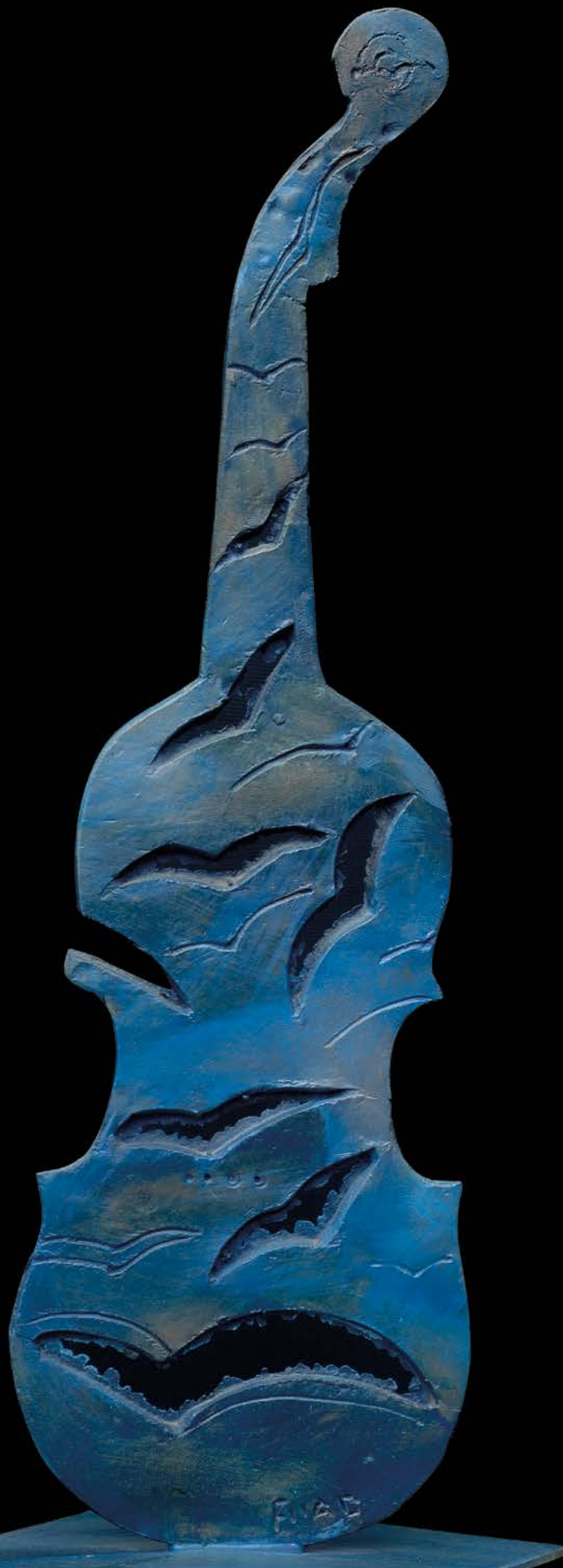
VOLINO BLU Bronzo, cm. 62x20x2