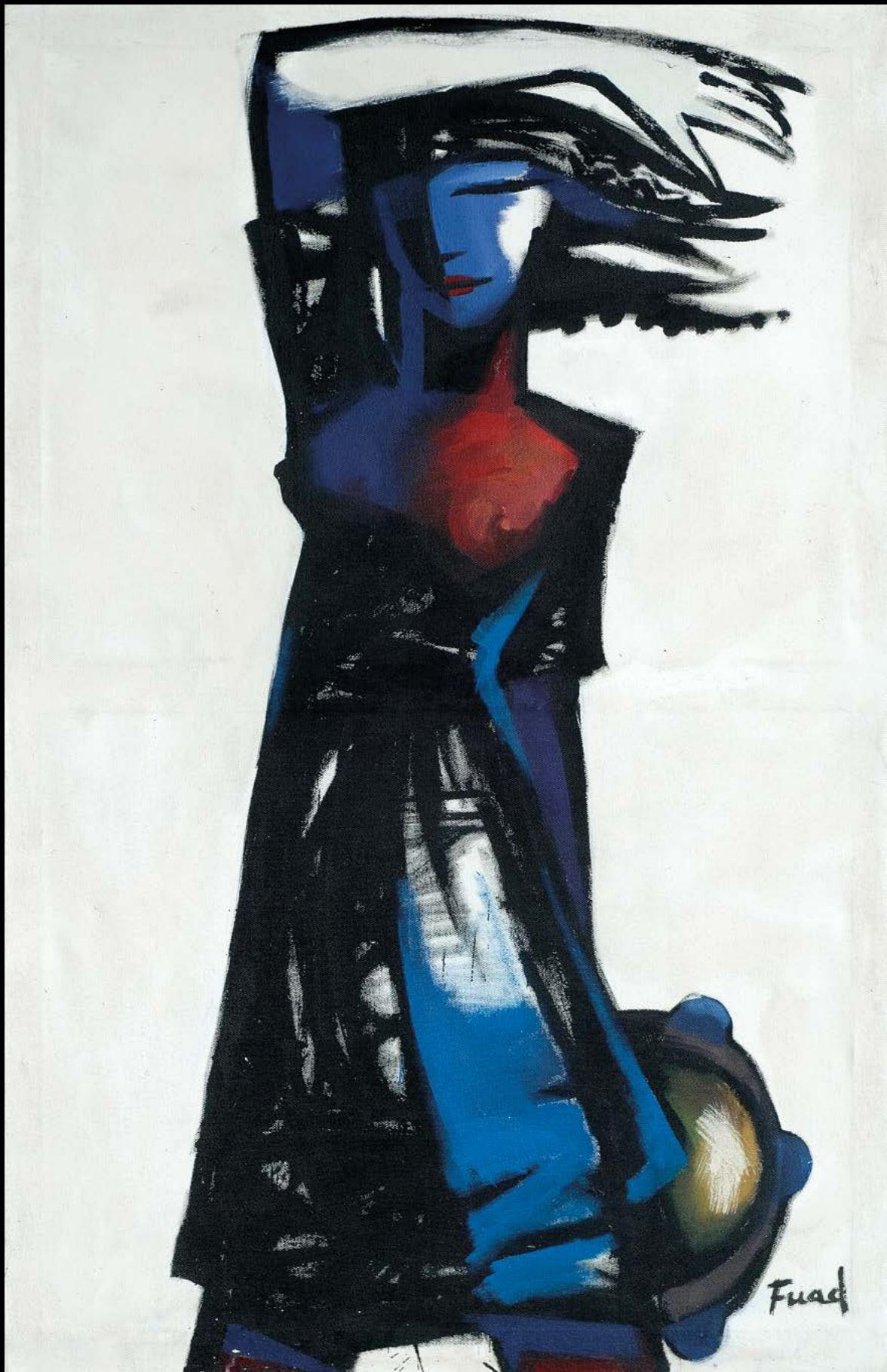
DANZATRICE Acrilico su tela, cm. 90x110