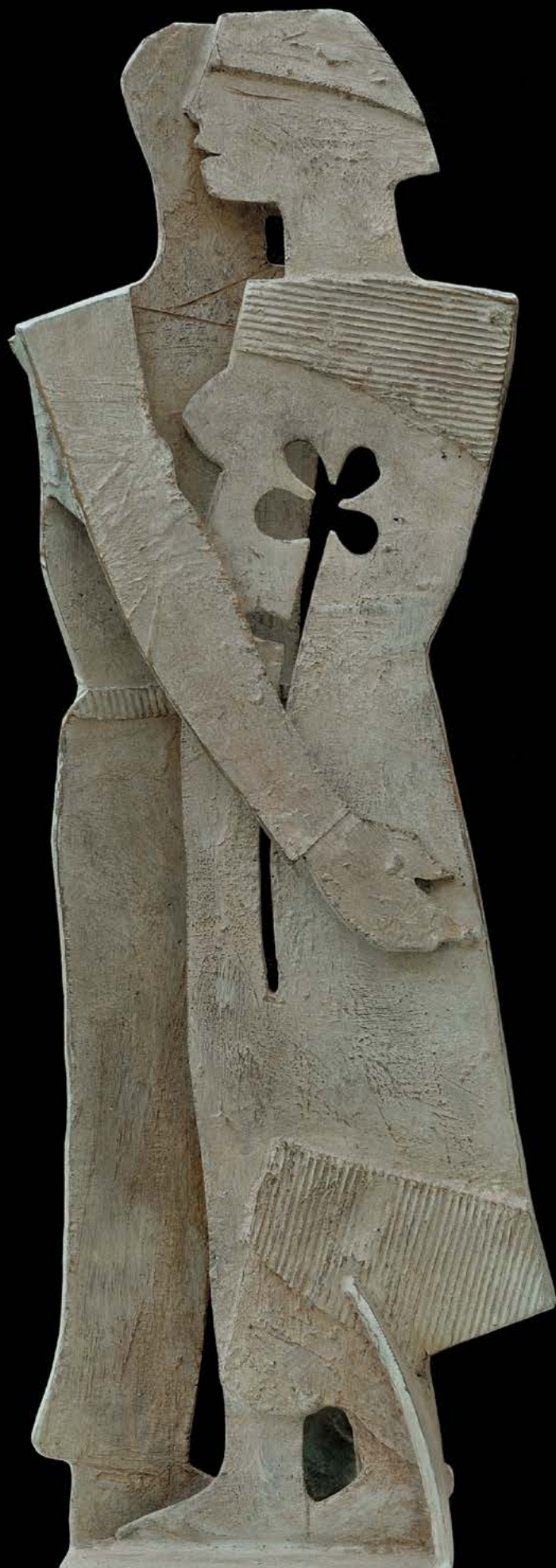
IL FIORE Bronzo, cm. 102x35x20