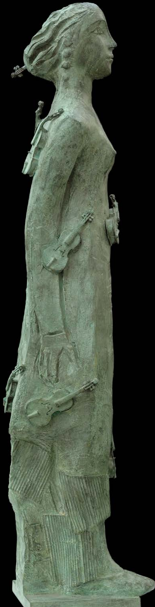
FANCIULLA Bronzo, cm. 120x24x24