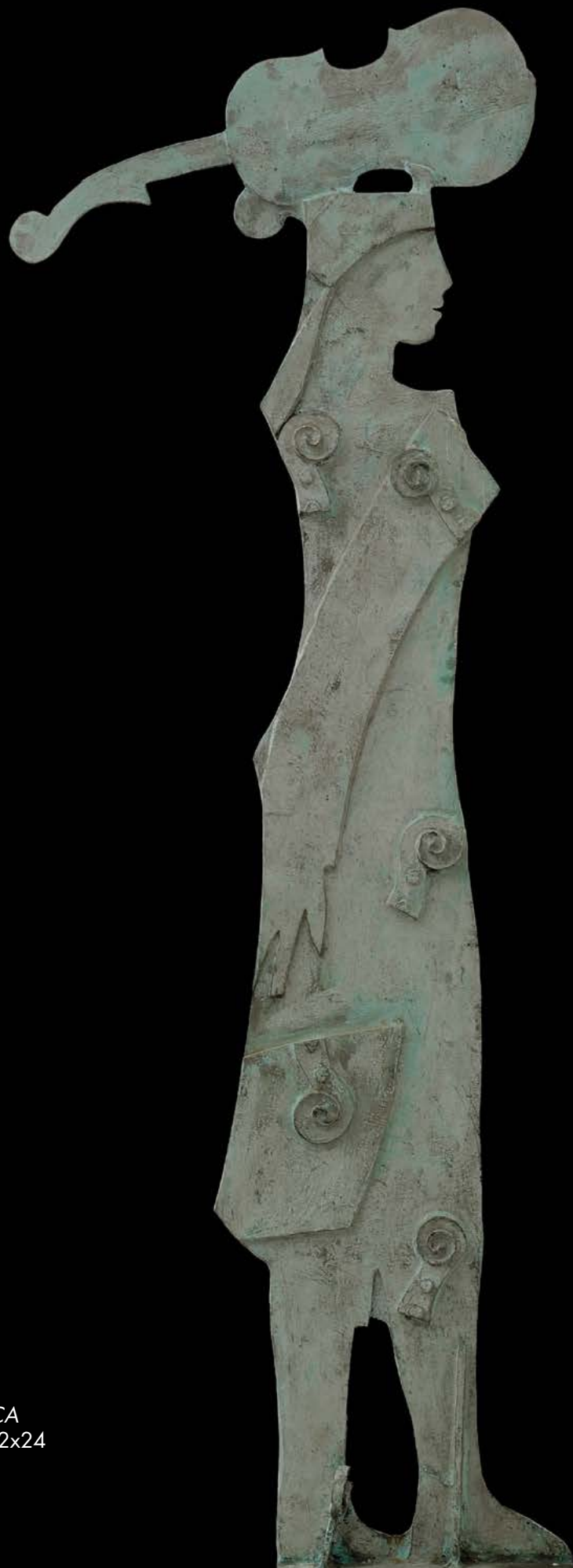
PORTARE LA MUSICA Bronzo, cm. 208x72x24