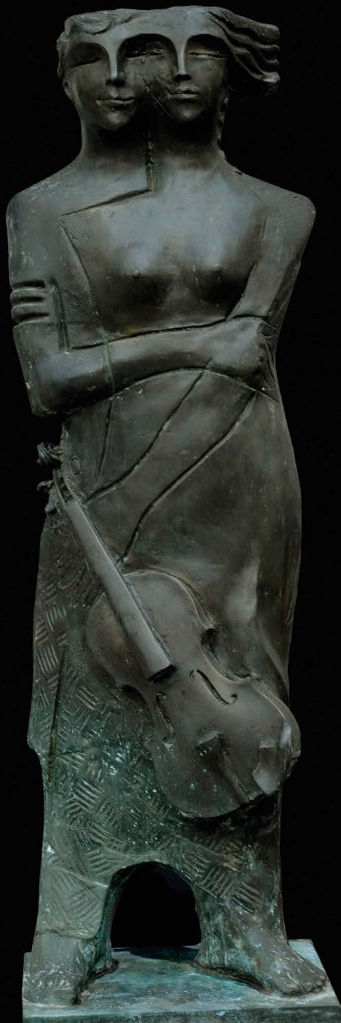
AMANTI Bronzo, cm. 138x33x42