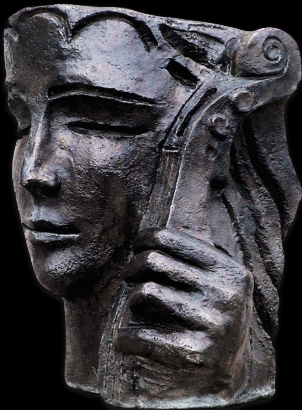
SUONATRICE Bronzo, cm. 32x 24x20