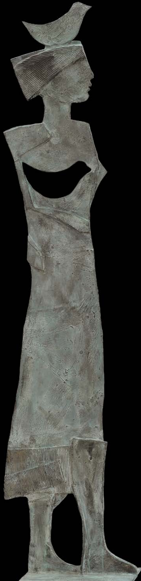
NEL CUORE Bronzo, cm. 198x26x38