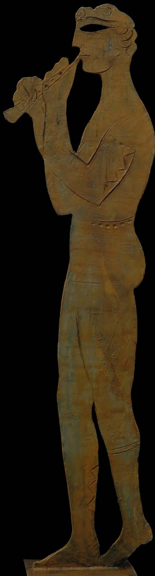
FLAUTISTA Bronzo, cm. 176x2x48