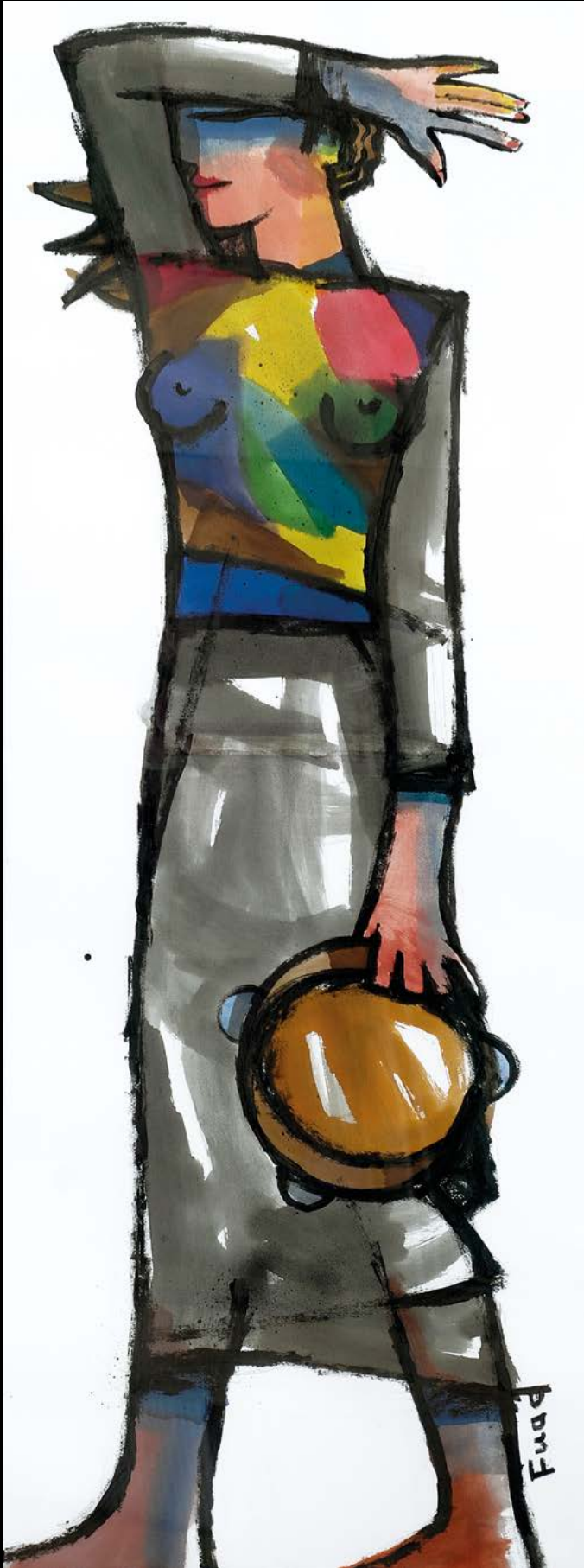
DANZATRICE Acrilico su tela, cm. 50x140