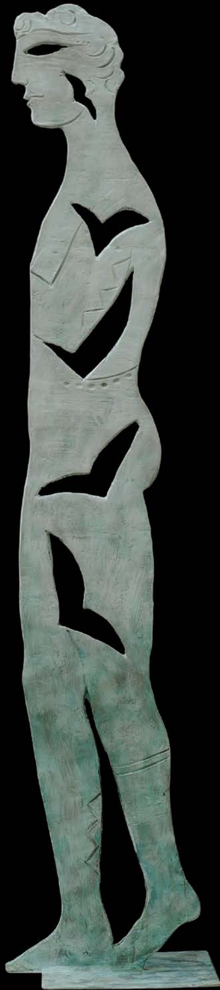
VOLO Bronzo, cm. 176x2x24