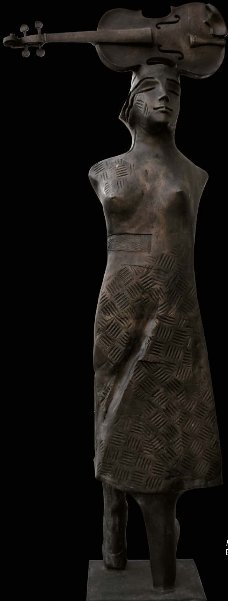
FIGURA CON VIOLINO Bronzo, cm. 156x30x58