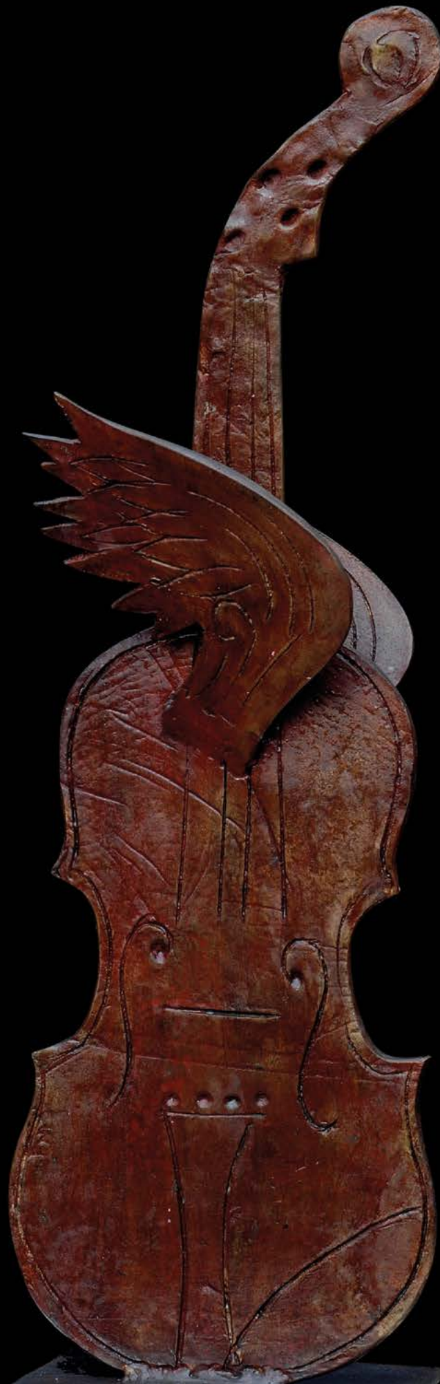
VOLINO LIBERO Bronzo, cm. 62x20x10